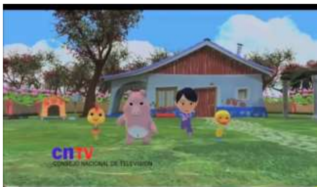
SIMÓN DICE CON EL PERRO CHOCOLO -

https://www.youtube.com/watch?v=vGb-V3xBmjA