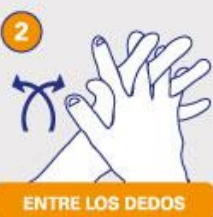
ENTRE LOS DEDOS