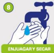
ENJUAGAR Y SECAR

ACTIVIDAD 2: MG. "GOLPEA EL GLOBO" Le daremos un globo a nuestro niño, el cual deberá jugar con el aventando hacia arriba y evitando que caiga al piso.