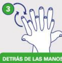
DETRÁS DE LAS MANOS