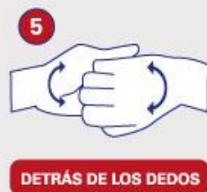
DETRÁS DE LOS DEDOS