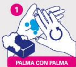
PALMA CON PALMA

Al comenzar, humedecer las manos con agua y jabón